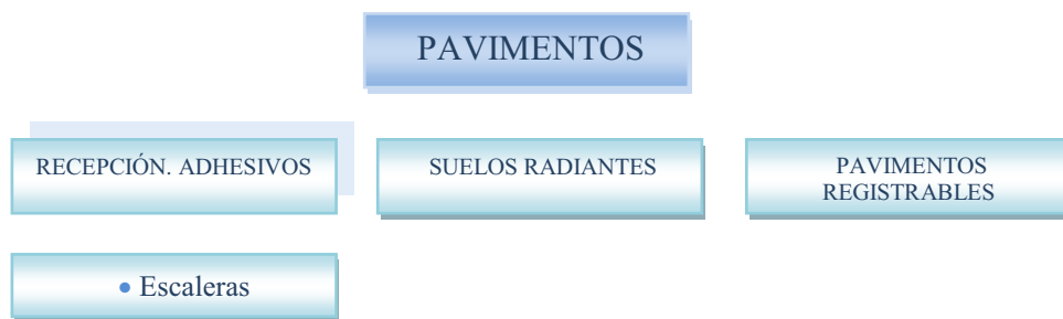
Imagen IV.1. Clasificación. Revestimientos horizontales. Autora

Relativo al tipo de revestimiento, y al formato del material las variantes presentes son: